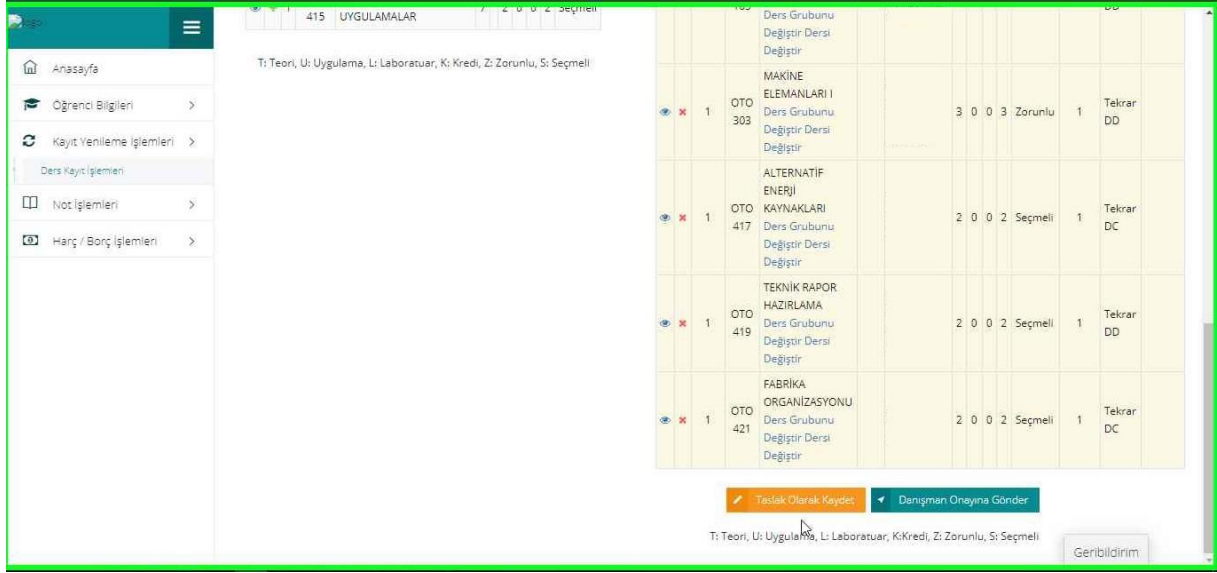
Resim-4: Kaydetme ekranı

4. Derslerinizi seçtikten ve Seçilen Dersleri ekledikten sonra “Seçilen Dersler” bölümüne geçerek derslerinizi son bir defa kontrol ederek aşağıda resimde gösterilen “Danışman Onayına Gönder” butonu vasıtasıyla derslerinizi, danışmanınıza gönderebilirsiniz. Danışman onayına göndermeden önce “Taslak Olarak Kaydet” butonu ile seçimini yaptığınız dersleri kaydedebilir, daha sonra tekrar düzenleyebilir ve seçilen dersleri kesinleştirdikten sonra danışman onayına gönderebilirsiniz.